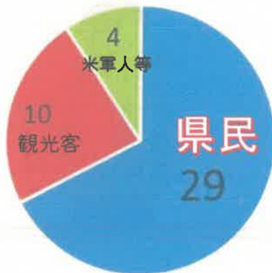
水難事故死者の特徴 (罹災者別、令和2年)